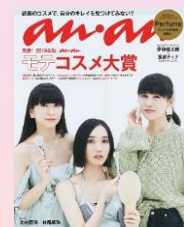
第11回 2019/9/18売 Perfume