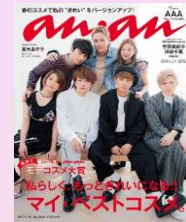
第6回 2017/3/8売 AAA