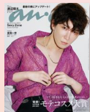
第16回 2022/2/22売 渡辺翔太 (Snow Man)