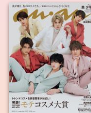
第18回 2023/2/22売 美少年