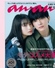
第12回 2020/2/26売 広瀬すず×吉沢亮