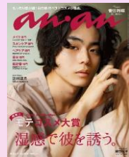
第5回 2016/9/14売 菅田将暉