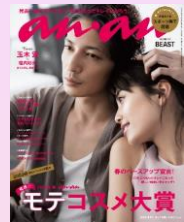
第4回 2016/3/9売 玉木宏 × 垣内彩未