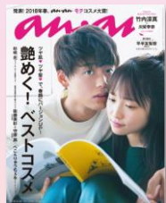
第8回 2018/3/20売 竹内涼真×川栄李奈