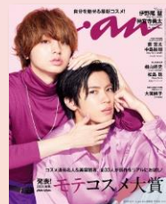
第15回 2021/8/25売 伊野尾慧×神宮寺勇太