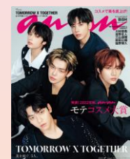
第17回 2022/8/31売 TOMORROW X TOGETHER