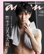
第13回 2020/8/19売 渡辺翔太 (Snow Man)