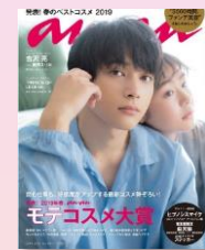
第10回 2019/3/20売 吉沢亮