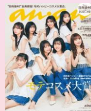
第14回 2021/2/24売 日向坂46