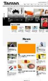
サイトトップ ページ